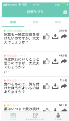
新しく投稿された質問を一覧表示する「フィード」

※このアプリは、「精神科外来における共同意思決定支援ツール 質問促進パンフレット」を元にアプリ化したものです。元々の質問促進パンフレットは統合失調症をもつ人を念頭に作成されたものですが、本アプリは疾患や悩み事の種類を問わず、利用することができます。