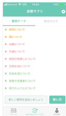
質問テーマ一覧、新しい質問が追加できる「質問テーマ」