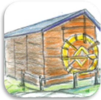
イラスト：夏苺柚子

精神科医とのコミュニケーションで困っている患者はたくさんいます。このアプリは、精神科の診察において患者と医師がより良いコミュニケーションをとれるためのツールです。